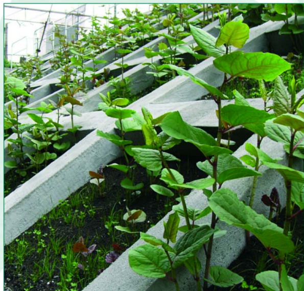
La Renouée du Japon au Japon – Talus de la gare de Kamakoura (au sud de la baie de Tokyo).

Parfaitement intégrées aux équilibres biologiques de leurs aires d'origine, les Renouées géantes s'y épanouissent de la mer aux montagnes, s'acquittant parfois même de la reconquête de coulées de lave solidifiées... Mais en Europe, elles ont trouvé des contrées vierges de parasites, d'insectes consommateurs ou encore de concurrentes sérieuses ; et notre climat très proche de celui du Nord-Est asiatique leur convient parfaitement ! Résultat : leur vitalité explose, faisant vaciller les équilibres en place.