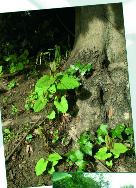
La Renouée du Japon au Japon – pousses printanières au pied d'un arbre ; parc de Ueno, au cœur de Tokyo.

Les Renouées s'étendent désormais chaque jour un peu plus, portées par l'eau et dispersées par les travaux ; engendrant de nombreux déséquilibres environnementaux et toujours plus de gênes pour les activités humaines.