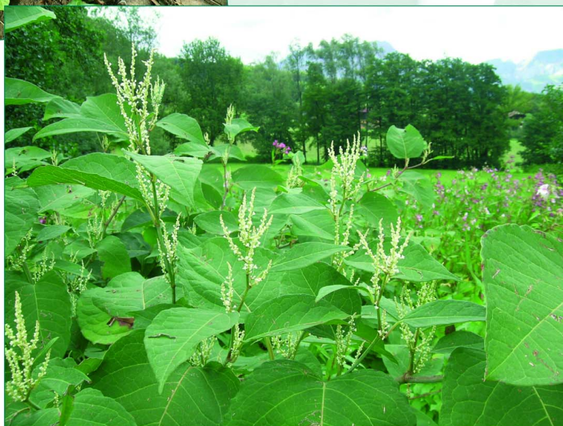
La floraison de la Renouée du Japon, un spectacle qui tend malheureusement à se banaliser...

Cette présentation succincte constitue la synthèse de diverses sources. Pour consulter ces sources, rendez-vous sur : www.frapna.org/ressources-renouees