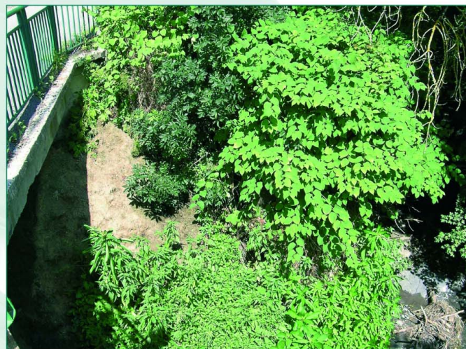
Exemple d'un massif bien implanté mais suffisamment localisé, pour espérer obtenir des résultats malgré la pente.

Comme pour d'autres espèces introduites, il reste permis d'espérer que les Renouées géantes finiront un jour par être intégrées aux équilibres biologiques européens. Mais cette éventualité incertaine ne signifie pas que la biodiversité n'aura alors pas nettement régressé. Devant l'ampleur du phénomène et devant la facilité de propagation de l'espèce – et notamment en bords de cours d'eau – l'adhésion de tous à un minimum de règles de vigilance et d'action est donc, semble-t-il, requis.